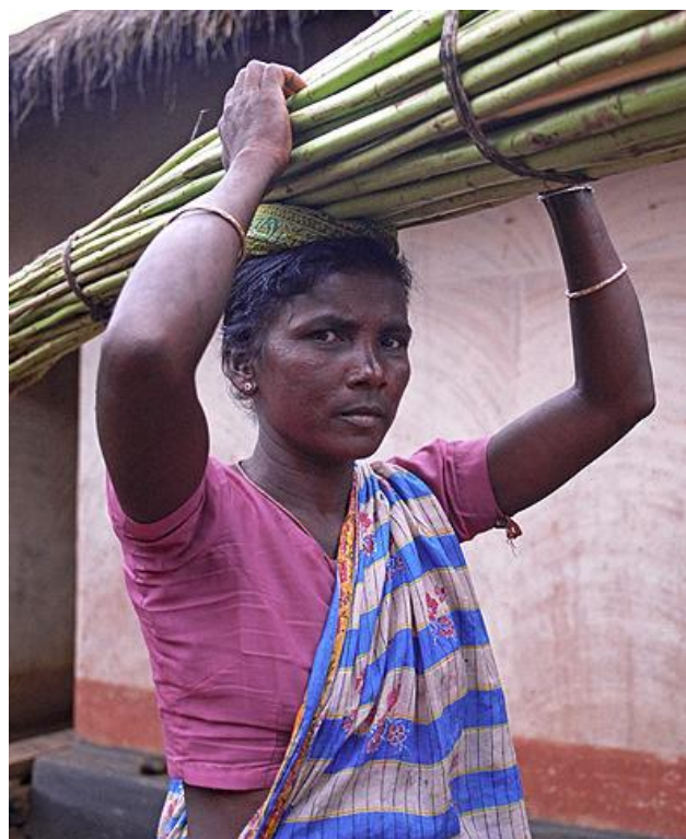
Adivasi leben von Waldprodukten wie etwa Bambus. Durch die Ausgangssperre infolge von "Corona" ist der Zugang zum Wald erschwert. Das Bild zeigt eine Santal-Frau.

https://www.thehindu.com/news/national/other-states/chattisgarhs-bastar-tribes-keep-coronavirus-at-bay/article31400382.ece