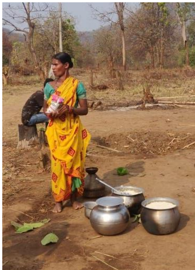
Hier war einmal das Adivasi-Dorf Nehla. Die Behausungen von 32 Familien wurden von den Forstbehörden trotz landesweiter Corona-Ausgangssperre zerstört. Die Familien wurden ihrem Schicksal überlassen.

https://www.groundxero.in/2020/04/25/odisha-governments-relentless-persecution-of-advasis-continue-even-during-the-lockdown/?fbclid=IwAR0hLI88IbWMk7KInjuirEc392C_jf92VGoyPIGv6_R-DGKjZZTyhwsBgA