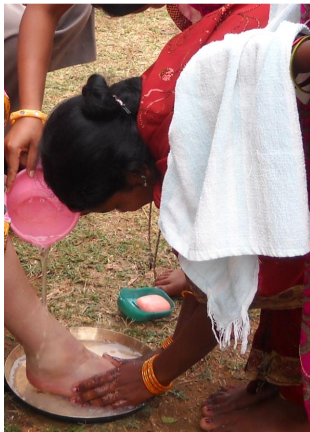
Bestandteil der Begrüßungszeremonie in einem Santal-Dorf: Dem Gast werden die Füße gewaschen.

Von den Gesamtkosten des Kraftwerkes – umgerechnet etwa 2 Mrd. Euro – soll bereits die Hälfte ausgegeben worden sein. Eine große Rolle bei der Gesamtbeurteilung des Projektes spielt der Plan, über eine 100 Kilometer lange Pipeline Wasser vom Ganges nach Godda zu transportieren. 36 Mrd. Liter sollen jährlich dem Fluß entnommen werden. Das Wasser wird benötigt, um die Kohle zu waschen und zur Kühlung des bei der Energieerzeugung entstehenden Wasserdampfes.