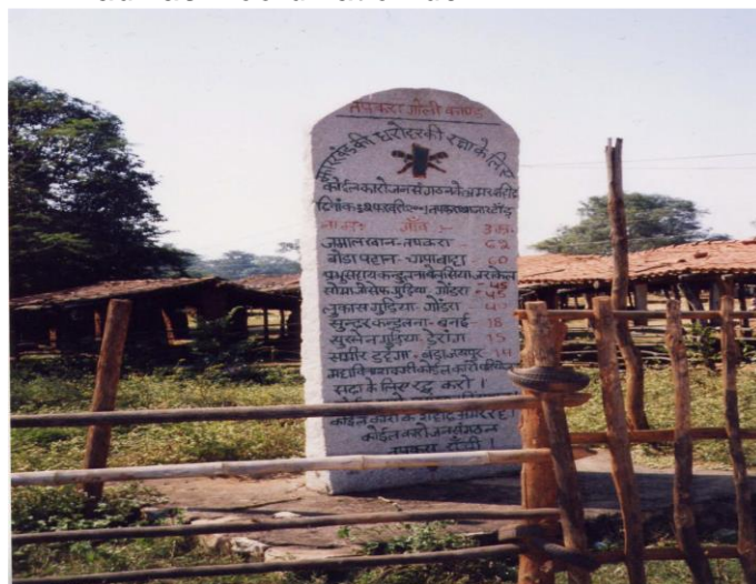
Gedenkstein in Tapkara in Erinnerung an die getöteten Demonstranten.