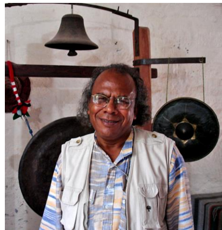
Ram Dayal Munda (1939 – 2011). Er nahm an der UN-Arbeitsgruppe für indigene Völker regelmäßig teil.

che Opfer von Eroberung und Kolonisierung im Rahmen ausländischer Invasionen geworden sind. Als Bürger*innen sind „scheduled tribes“ lediglich „rückständige Völker“, welche einen Aufschwung, Eingliederung in den „mainstream“ der Gesellschaft und positive Diskriminierung benötigen [...]. Der Begriff „scheduled tribe“ an sich führt dazu, daß ein Kernbereich der Adivasi-Geschichte in den Hintergrund gedrängt wird. Nicht nur die Verfassung verweigerte uns Rechte als Ureinwohner*innen, Adivasi oder indigene Völker.