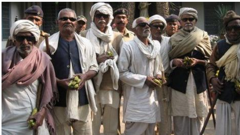
Inhaftierte aus dem Gefängnis von Buxar, Bihar. Sie erhielten in einem gemeinnützigen Krankenhaus eine Graue Star-Operation (Symbolbild).

- Solidarität mit Indiens Ureinwohnern - Hg.: Adivasi-Koordination in Deutschland e.V. Jugendheimstr.10, 34132 Kassel April 2018