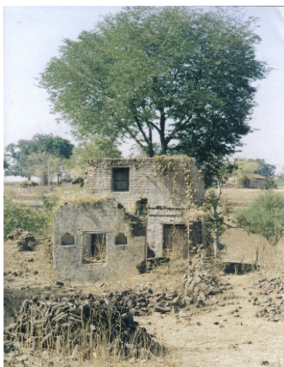
Foto: Maan-Staudamm- zerstörte Häuser

Der Verlust des Landes und der natürlichen Ressourcen führt zu einem regelrechten Kampf um das Überleben. Einige der Adivasi waren in der Lage, wieder Land zu erwerben. Sie mussten jedoch starke wirtschaftliche Verluste hinnehmen. Weniger Land bedeutet weniger Ernte. Der Staudamm bedeutet weniger Wasser im Flusslauf und damit längere Trockenperioden. Bei vielen Familien reduzierte sich die Zahl Ernten auf ein bis zwei pro Jahr. Auch das Abholzen der Wälder hat drastische Auswirkungen auf den Lebensstil der Adivasi. Früchte, Wurzeln, Beeren, Nüsse und Heilkräuter, die eine vielfältige Ernährung ermöglichen, entfallen. Für Feuerholz müssen immer längere Wegstrecken zurückgelegt werden. Die Zerstückelung der Dorfgemeinschaften stellt die Adivasi außerdem vor neue Herausforderungen hinsichtlich ihres sozialen Zusammenhaltes. Viele Betroffene mussten in die Städte abwandern und sich mit Gelegenheitsarbeiten als Rikschafahrer oder auf Baustellen herumschlagen. Hierzu kommt, dass die Adivasi für gewöhnlich die billigsten ArbeiterInnen sind und sie am rücksichtslosesten ausgebeutet werden. In den Städten sind sie neuen Abhängigkeitsverhältnissen ausgeliefert, die sie vorher in ihrem relativ autarken Lebensstil nicht kannten. So berichteten Betroffene: „Das Wasser kommt aus Leitungen, die Medizin in Tabletten und das Licht durch Kabel. Wir müssen Viehfutter kaufen. Alles hängt von irgendwelchen anderen ab. Alles muss bezahlt werden.“