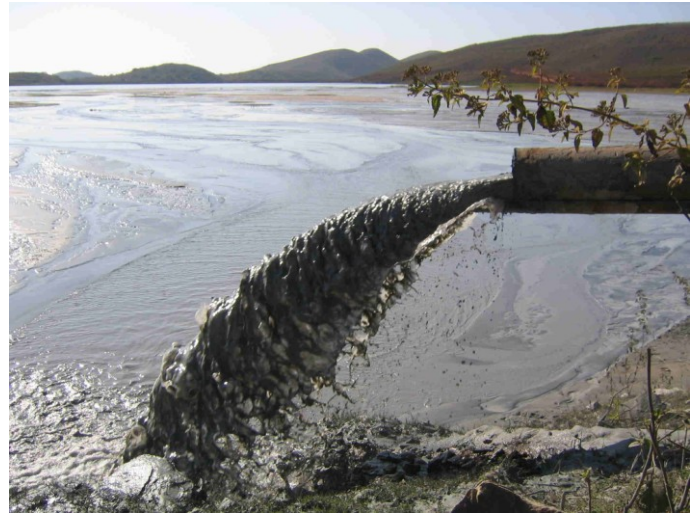
Bei der Bauxit-Gewinnung durch NALCO verschmutztes Wasser wird einfach in die Natur zurückgeleitet.

Nachdem also die Aluminium-Industrie in Kashipur keinen Erfolg fand, wickelte sie in den Distrikt Kalahandi aus. Im Jahr 2003 kündigte Sterlite India Ltd. die Eröffnung eines neuen Abbauprojekts und die Errichtung von Verarbeitungsstätten im Block Lanjigarh an. Dieses Gebiet grenzt direkt an den Block Kashipur. Das Bauxit soll im Tagebau auf den Niyamgiri Hills gewonnen werden. Dies sind jedoch die heiligen Berge der Kondh-Adivasis, ein Gebiet,