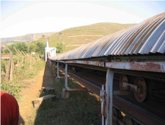
Kilometerweit transportiert ein Förderband das Bauxit-Gestein vom Berggipfel zu den Verarbeitungsstätten in der Ebene.

Bald darauf trat die Polizei auf den Plan. Gegen eine Reihe von Sprechern der Bewegung und auch gegen auswärtige Unterstützer wurden Anklagen konstruiert, sie wurden vorübergehend inhaftiert. Es kam zu Misshandlungen und gewalttätigen Übergriffen der Polizei. In dieser Zeit wurde der Widerstand der Menschen von Kashipur auch international bekannt und unterstützt. Die Protestbewegung weitete sich noch mehr aus. Im Dezember 2000 kam es zum bisher schlimmsten Zwischenfall: Die Polizei führte in dem kleinen Ort Maikanch eine Razzia durch, die Menschen versammelten sich zum Protest gegen diese unverhältnismäßig rücksichtslos durchgeführte Maßnahme, woraufhin die Polizei von ihren Waffen Gebrauch machte. Drei Menschen wurden erschossen und acht weitere verletzt. Nach diesem Zwischenfall und wegen der internationalen Proteste zog sich die norwegische Firma (Norsk Hydro) aus dem Projekt zurück und verkaufte ihre Anteile an die anderen Firmen. Auch in Kanada werden inzwischen kritische Stimmen laut und fordern eine Überprüfung der geschäftlichen Verbindungen.