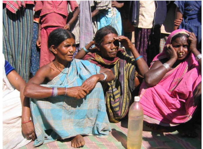
Kondh-Frauen aus Maikanch, dem Ort der Polizeischüsse im Dezember 2000.

1996 hatte der Oberste Gerichtshof in einer bemerkenswerten Entscheidung ein Verbot des Landverkaufs und des Abbaus - ja sogar nur der Exploration - von Bodenschätzen in den anerkannten Stammesgebieten ausgesprochen. Die Landesregierung von Orissa behauptet, mit ihren eigenen Gesetzen den Schutz und die Förderung der Adivasis zu gewährleisten. Sie verkündet explizit die These, dass Landerwerb für Industrieansiedlungen wie auch der Abbau von Bodenschätzen in den Stammesgebieten ermutigende Ergebnisse in der sozio-ökonomischen Entwicklung der Stammesbevölkerung zeitigen würde. Und sie weist deshalb die Geltung des Urteils für Orissa ab. Der Industrieminister von Orissa hat zudem angekündigt, dass die Regierung keinen weiteren Widerstand dulden werde.